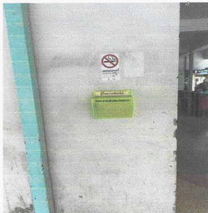
จุดที่ ๔ ข้างห้องคลอด