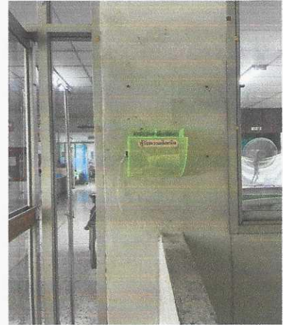
จุดที่ ๓ หน้าตึกคัดลอกกรรมชาย