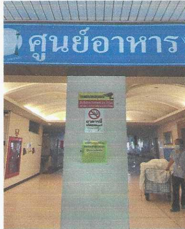
จุดที่ ๒ ศูนย์อาหาร