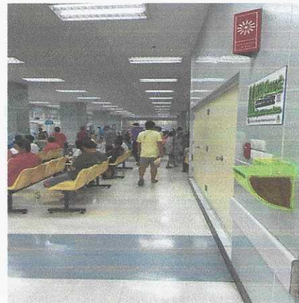
จุดที่ ๕ อาคารเฉลิมพระเกียรติ ๘๐ พรรษา ชั้น ๒